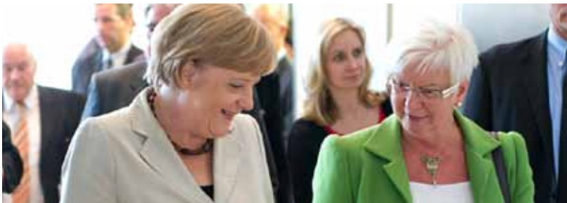
Bundeskanzlerin Merkel im Gespräch mit der CSU-Landesgruppenvorsitzenden Gerda Hasselfeldt

Der Koalitionsausschuss der christlich-liberalen Koalition hat am vergangenen Sonntag wegweisende Entscheidungen zu Betreuungsgeld, Verkehrsinfrastruktur, Rente und Praxisgebühr auf den Weg gebracht. Mit diesen wichtigen Entscheidungen hat die Koalition die Weichen für das letzte Jahr vor der Bundestagswahl 2013 gestellt.