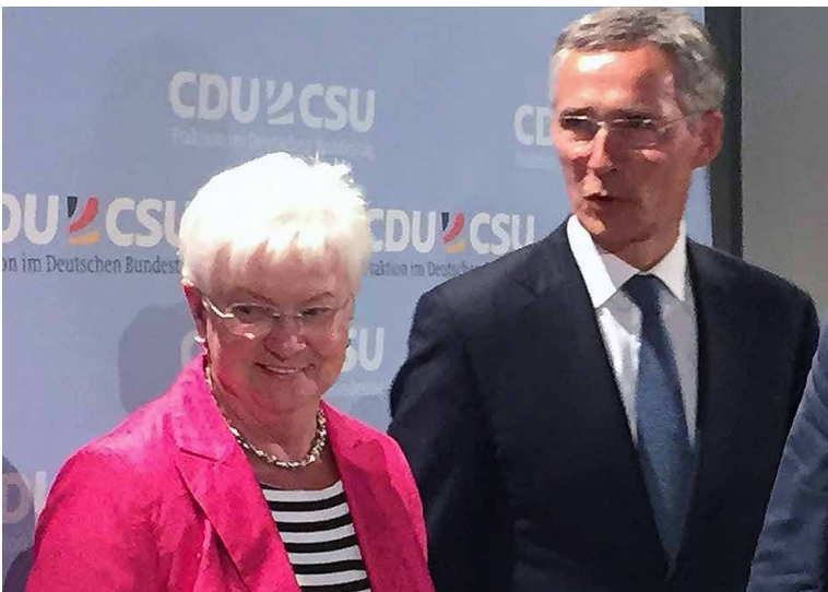
Gerda Hasselfeldt und der NATO-Generalsekretär Jens Stoltenberg

Mit NATO-Generalsekretär Jens Stoltenberg diskutierte der Fraktionsvorstand die internationalen Herausforderungen und Krisen der Welt. Ganze Regionen sind von Kriegen und Konflikten zerrüttet. Die Auswirkungen dieser Entwicklungen sind bis nach Deutschland und Europa zu spüren – nicht zuletzt durch die Flüchtlingsbewegung. Die Unionsfraktion hat deshalb jetzt ein Papier beschlossen, in dem sie ein Bekenntnis zu einer starken Bundeswehr in einer starken NATO ablegt. Die aktuellen sicherheitspolitischen Herausforderungen führen zu einer Rückbesinnung auf den Wert stabiler Bündnisse wie der EU und der NATO. Deutschland könne „Sicherheit nur gemeinsam mit unseren internationalen Partnern erreichen“, heißt es in dem Papier. Deshalb setzt sich die CDU/CSU-Fraktion für eine signifikante Erhöhung des Verteidigungshaushaltes ein.