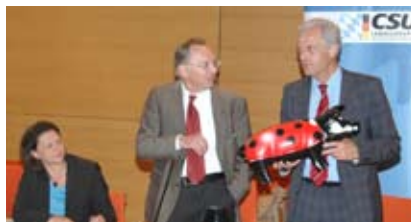
Bauernpräsident Gerd Sonnleitner überreicht Peter Ramsauer im Beisein von Bundeslandwirtschaftsministerin Ilse Aigner ein künstlich gestaltetes Glücksschwein in Anerkennung des CSU-Einsatzes für die Landwirte.

für die Bauern in Deutschland ist.“ Bauernverbandspräsident Sonnleitner wies auch auf die große wirtschaft-