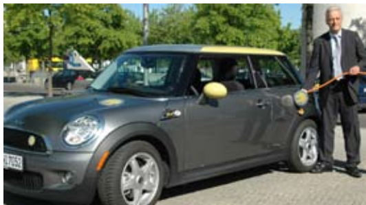
„Sprit“ aus der Steckdose: Verkehrsminister Dr. Peter Ramsauer beim symbolischen „Betanken“ eines innovativen Elektro-Minis

Konzept, das von der Stromerzeugung und -verteilung über die Entwicklung einer Lade-Infrastruktur bis hin zur Datenerfassung und Abrechnung geladener Strommengen reicht.