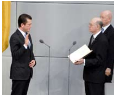
Dr. Karl-Theodor zu Guttenberg bei seiner Vereidigung zum Bundeswirtschaftsminister

führenden Wirtschaftsnation aufgestiegen. Daher dürften die ordnungspolitischen Leitplanken der sozialen Marktwirtschaft nicht panisch ab-